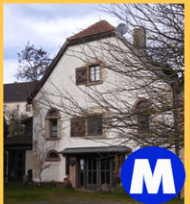
M Rudi Muth Schlossweg 7