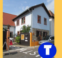
T Tonhaus Segger Leininger Ring 85