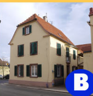
B Weingut Bengel Weinstr. 22