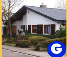
G Skulpturengarten Göbel Am Kinderbach 25