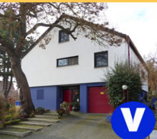
V Gartenpark Völker Unterer Graben 7a