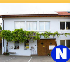
N Flechtwerk Nickel Hauptstraße 40