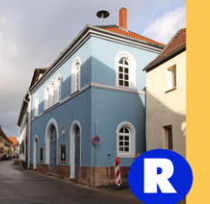
R Blaues Rathaus Leininger Ring 62