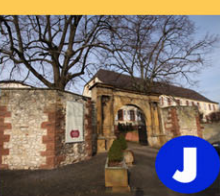
J Schlossgut Janson Schlossweg 8